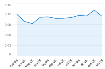
Grafico indice (12 mesi)

Altri Corrispettivi* | I valori aggiornati dei corrispettivi di dispacciamento, del mercato della capacità, della tariffa per l'uso della rete elettrica e degli oneri generali di sistema si possono consultare al seguente indirizzo: https://www.arera.it/consumatori